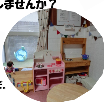
おもちゃもたくさんあります♪