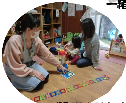
親子でほっとできま～す♡