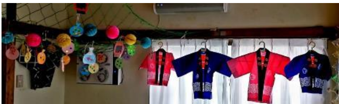
夏祭り、せめて気分だけでも・・・ということで、 ヨーヨーをデコって飾って、ハッピーを着てポーズ♪