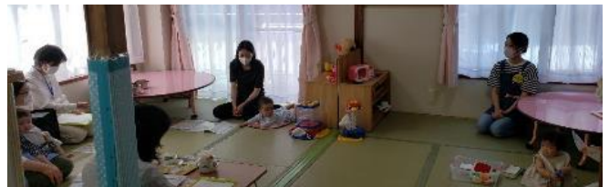
「実演もまじえて、離乳食のことをしっかりききました。」 「個別の質問にも答えていただけて、満足です。」