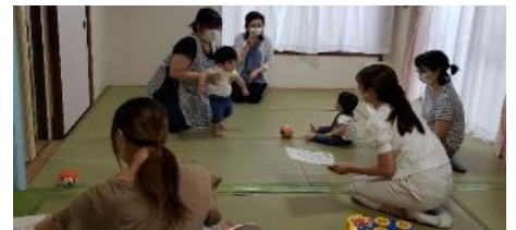
「イヤイヤ期の歯磨きのコツなどききました。」 「講座の最中に動き回る子どもを見てくれて助かりました。」

夏祭り工作 歯科衛生士さんにきいてみよう ベビーマッサージ 管理栄養士さんにきいてみよう これから聞きたい話、 楽しみたいイベントについて等、 皆様の声も聴かせてくださいね♪