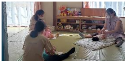
「してもらっ赤ちゃんはもちろん、 してあげている私もなんだかほっこり気持ちいい!」