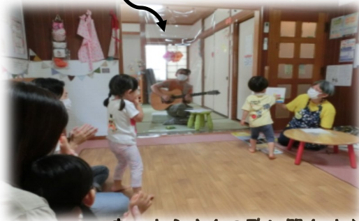
まっとうさんの歌い聞かせ♪